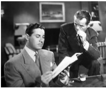
1946 TWO SMART PEOPLE de Jules Dassin avec John Hodiak