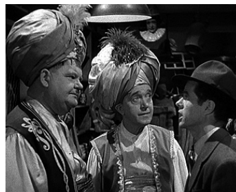
1942 FANTÔMES DÉCHAÎNÉS (A Haunting we will go) d'Alfred Werker avec Laurel & Hardy