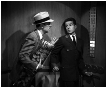
1941 FOLIE DOUCE (Love Crazy) de Jack Conway avec William Powell