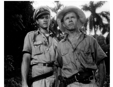
1957 VOODOO ISLAND de Reginald Le Borg avec Murvyn Vye