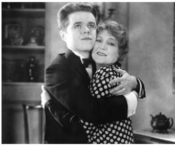
1930 HER UNBORN CHILD d'Albert Ray avec Frances Underwood