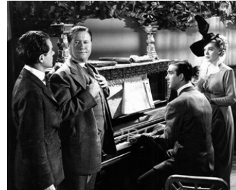
1940 TIN PAN ALLEY (Tin Pan Alley) de Walter Lang avec Jack Oakie, Alice Faye, John Payne