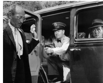
1957 L'ENNEMI PUBLIC (Baby Face Nelson) de Don Siegel avec Mickey Rooney