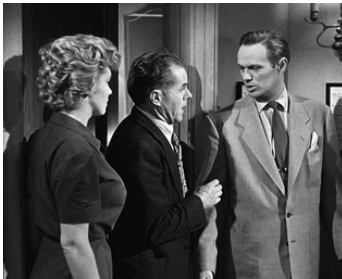
1952 TROUBLEZ-MOI CE SOIR (Don't bother to knock) de Roy Baker avec M. Monroe, R. Widmark