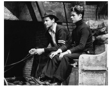
1936 TWO IN A CROWD d'Alfred E. Green avec Joel McCrea