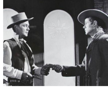
1954 L'AIGLE SOLITAIRE (Drum Beat) de Delmer Daves avec Alan Ladd