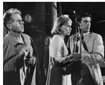
1968 ROSEMARY'S BABY de Roman Polansky avec Mia Farrow, John Cassavetes