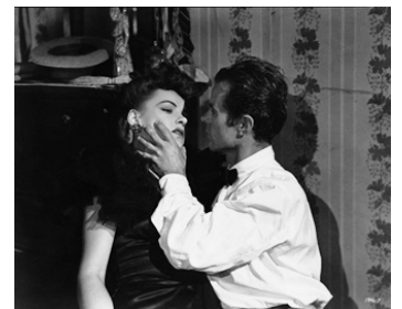
1944 LES MAINS QUI TUENT (The Phantom Lady) de Robert Siodmak avec Ella Raines