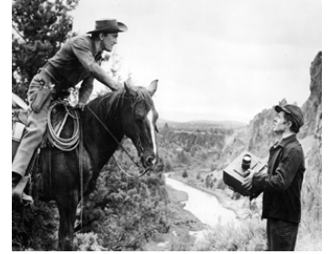
1955 LA RIVIÈRE DE NOS AMOURS (The Indian Fighter) d'André de Toth avec Kirk Douglas