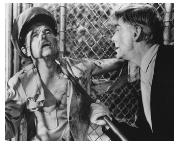
1963 LES FAUVES MEURTRIERS (Black Zoo) de Robert Gordon avec Michael Gough