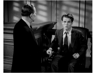
1940 L'INCONNU DU TROISIÈME ÉTAGE (Stranger on the Third Floor) de Boris Ingster