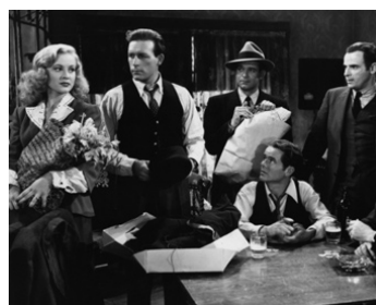
1945 DILLINGER (Dillinger) de Max Nosseck avec Anne Jeffreys, Lawrence Tierney