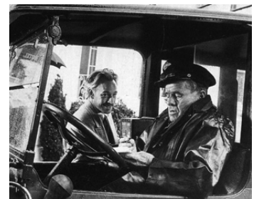
1982 HAMMETT (Hammett) de Wim Wenders avec Frederick Forrest