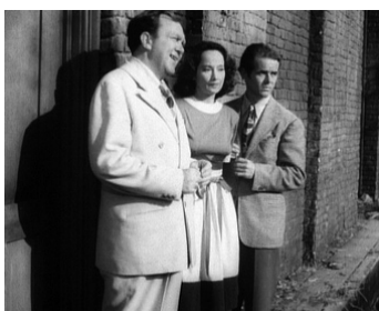
1944 DARK WATERS (Dark Waters) d'André de Toth avec Thomas Mitchell, Merle Oberon