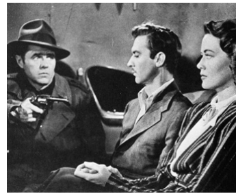
1949 FLAXY MARTIN (Flaxy Martin) de Richard L. Bare avec Zachary Scott, Dorothy Malone