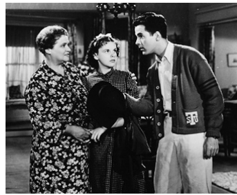
1936 PIGSKIN PARADE de David Butler avec Judy Garland