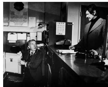
1976 MONSIEUR SAINT IVES (St. Ives) de Jack Lee Thompson avec Charles Bronson