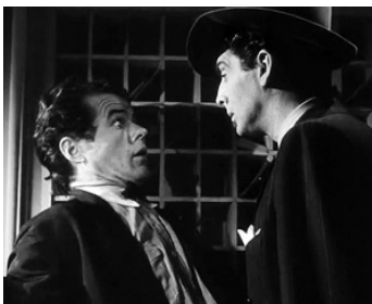
1941 QUI A TUÉ VICKY LYNN ? (I wake up screaming) de H. Bruce Humberstone avec Victor Mature