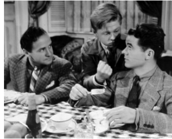
1937 THOROUGHBREDS DON'T CRY d'Alfred E. Green avec Ch. D. Brown, Mickey Rooney