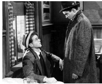
1933 L'AMOUR EN PREMIÈRE PAGE (Love in News) de Tay Garnett avec Tyrone Power