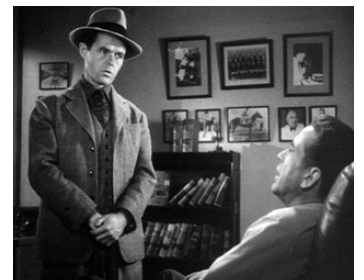
1946 LE GRAND SOMMEIL (The big Sleep) d'Howard Hawks avec Humphrey Bogart