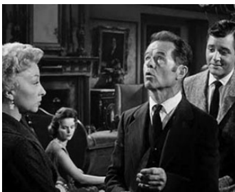
1958 LA NUIT DE TOUS LES MYSTÈRES (House of haunted Hill) de W. Castle avec C. Craig, R. Long