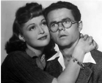
1940 IL ÉPOUSE SA FEMME (He married his Wife) de Roy del Ruth avec Nancy Kelly