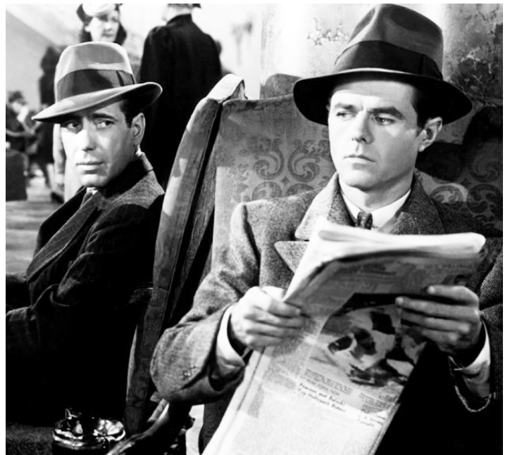
1941 LE FAUCON MALTAIS (The Maltese Falcon) de John Huston avec Humphrey Bogart