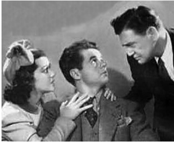
1937 THE DEVIL IS DRIVING de Harry Lachman avec Richard Dix, Joan Perry