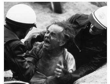
1973 ELECTRA GLIDE IN BLUE de James W. Guercio avec Robert Black, Billy Green Bush