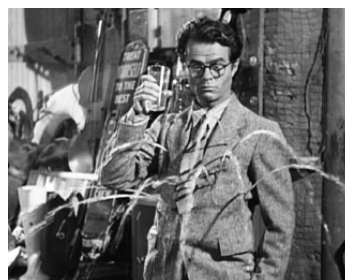
1942 HELLZAPOPPIN (Hellzapoppin) d'Henry C. Potter