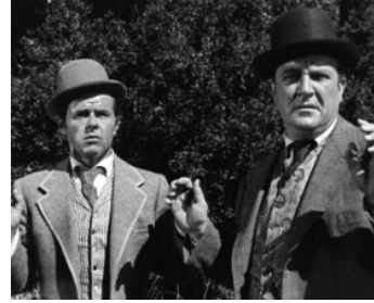
1953 LA TRAHISON DU CAPITAINE PORTER (Thunder over the Plains) d'A. De Toth avec Hugh Sanders