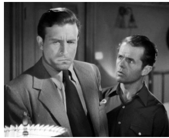
1947 NÉ POUR TUER (Born to Kill) de Robert Wise avec Lawrence Tierney