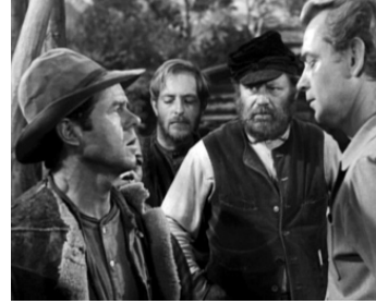
1953 L'HOMME DES VALLÉES PERDUES (Shane) de George Stevens avec Alan Ladd