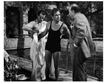
1949 LE PRIX DU SILENCE (The great Gatsby) d'Elliot Nugent avec Alan Ladd, Ed Begley